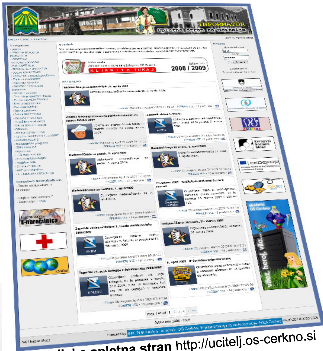
učiteljska spletna stran http://ucitelj.os-cerkno.si