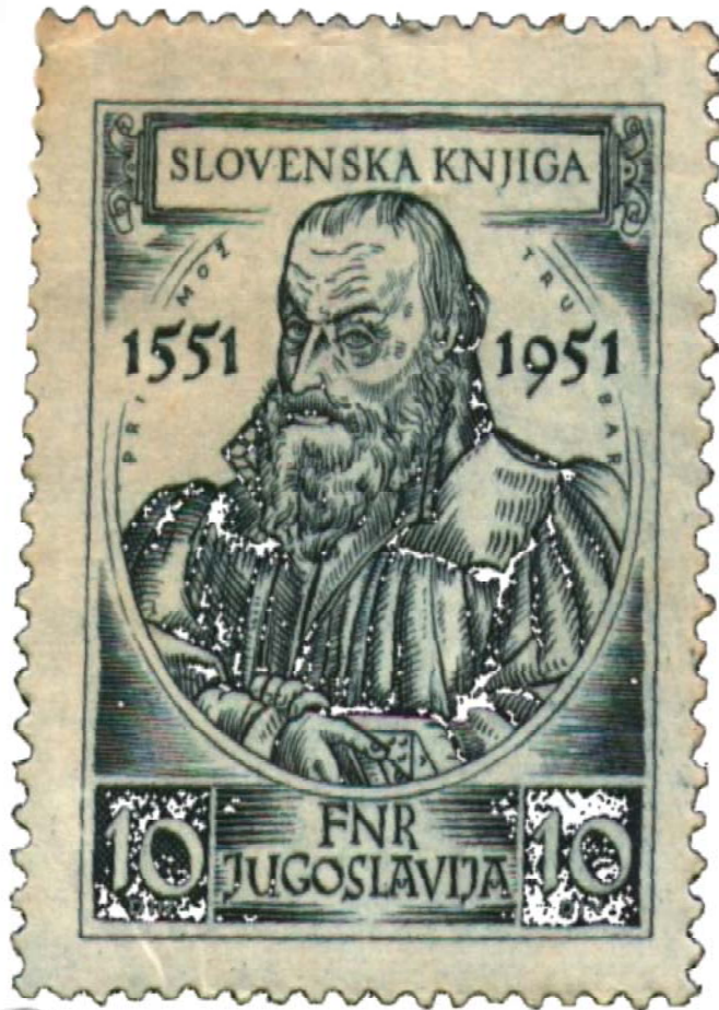
Primož Trubar Karniola