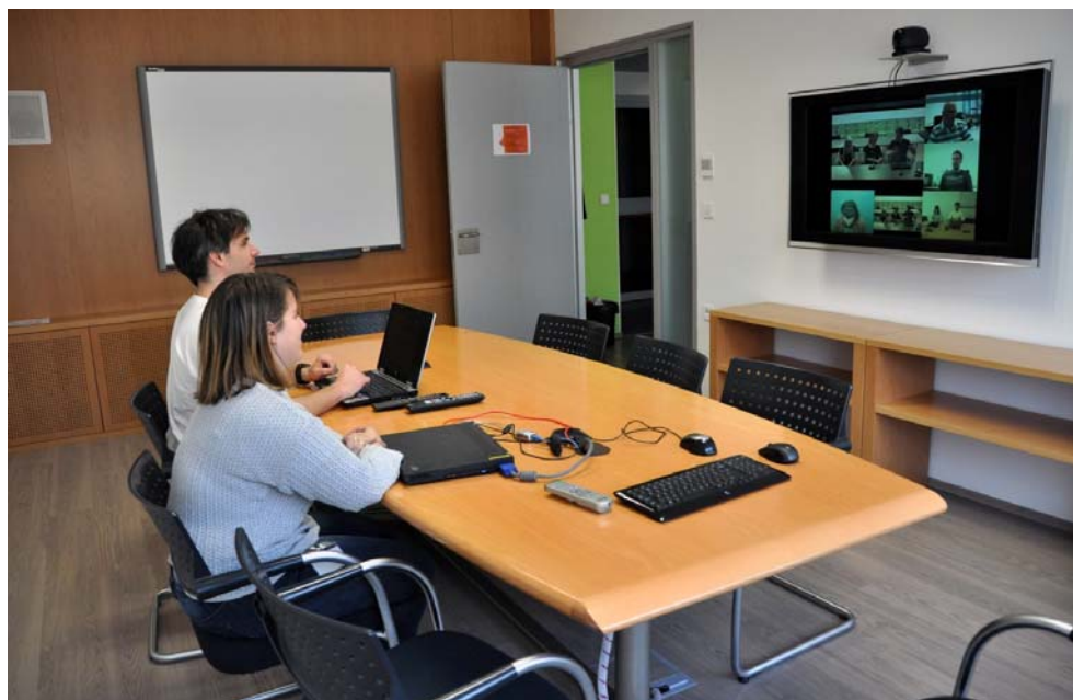
Slika 1: Sobni videokonferenčni sistem s kamero in namiznimi mikrofoni, ki je priključen na LCD TV

Za namizne videokonferenčne sisteme je značilno, da: