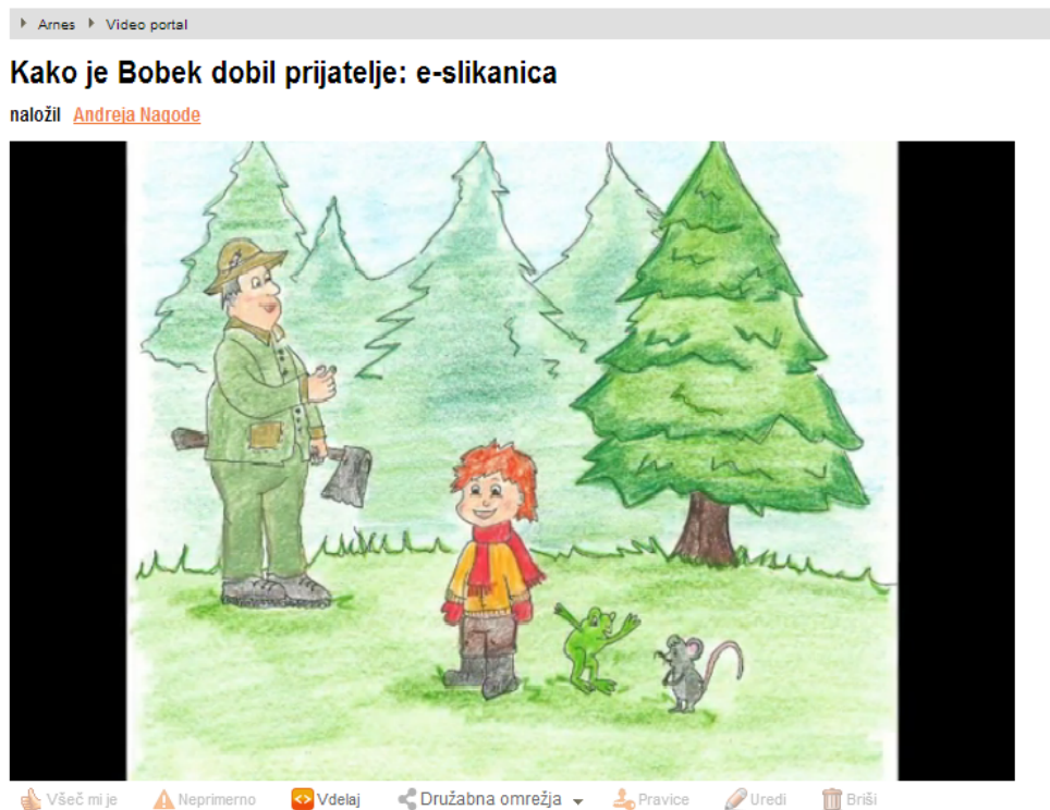
SLIKA 6: E-SLIKANICA, OBJAVLJENA NA ARNESOVEM VIDEOPORTALU

Potem jim je prek storitve FileSender poslala še fotografije njihovega zadnjega druženja. Prejšnjo uro KIZ-a so učenci namreč obiskali bližnjo splošno knjižnico. Fotografije pravljичne urice je knjižničarka sicer že objavila na spletni strani šolske knjižnice, sedaj pa je učiteljicam poslala vse fotografije, da jih bodo lahko shranile in jih učencem poklonile ob koncu šolskega leta. Ker jih je bilo veliko, se je odločila za pošiljanje prek storitve FileSender, ki omogoča pošiljanje dokumentov do velikosti 2 GB v večini brskalnikov s podprto tehnologijo Flash.