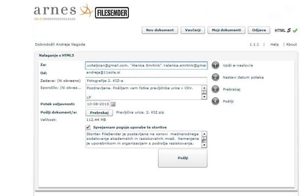
SLIKA 7: VSE KORAKE DELA V FILESENDERJU NAREDITE NA ENI SPLETNI STRANI

Potem jim je prek storitve FileSender poslala še fotografije njihovega zadnjega druženja. Prejšnjo uro KIZ-a so učenci namreč obiskali bližnjo splošno knjižnico. Fotografije pravljичne urice je knjižničarka sicer že objavila na spletni strani šolske knjižnice, sedaj pa je učiteljicam poslala vse fotografije, da jih bodo lahko shranile in jih učencem poklonile ob koncu šolskega leta. Ker jih je bilo veliko, se je odločila za pošiljanje prek storitve FileSender, ki omogoča pošiljanje dokumentov do velikosti 2 GB v večini brskalnikov s podprto tehnologijo Flash.