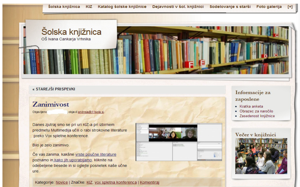
SLIKA 3: OBJAVA NA SPLETNI STRANI ŠOLSKE KNJIŽNICE

Objavila je kratek prispevek o jutranji uri KIZ-a, ki je potekala na drugačen način. V novičko je dodala tudi URL-povezavo do posnetka spletne konference VOX.